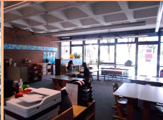
Drei unserer Gruppenräume